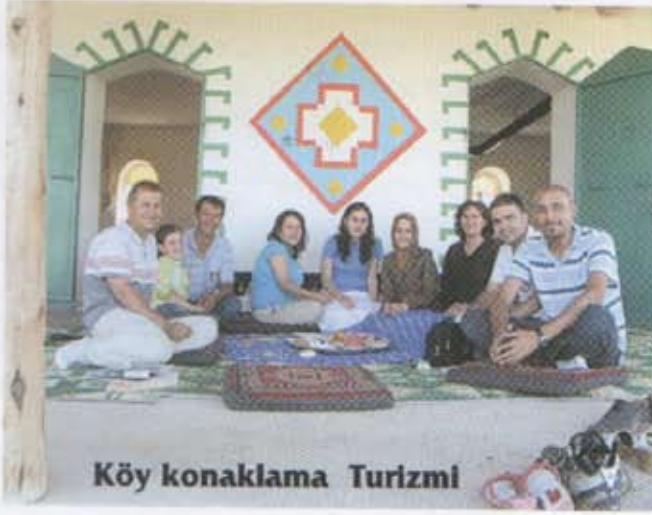
Köy konaklama Turizmi