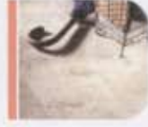
pisida cappuccino / honed