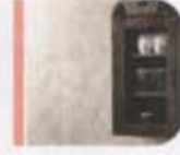
pisida cappuccino / honed