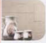
pisida beige / honed