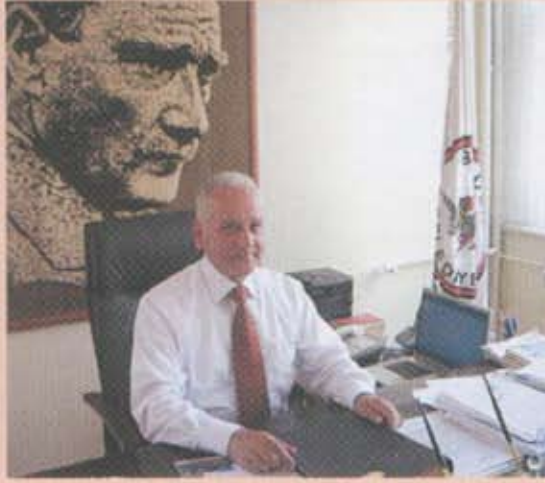
Burdur Belediye Başkanı Sebahattin AKKAYA