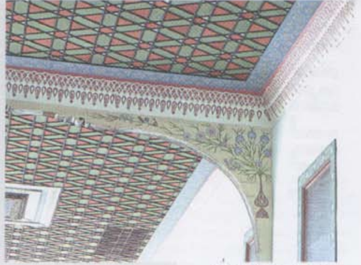
Bakıbey Konağundan Süsleme