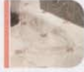
pisida cappuccino / polished