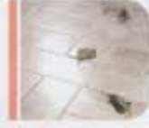
pisida cappuccino / honed