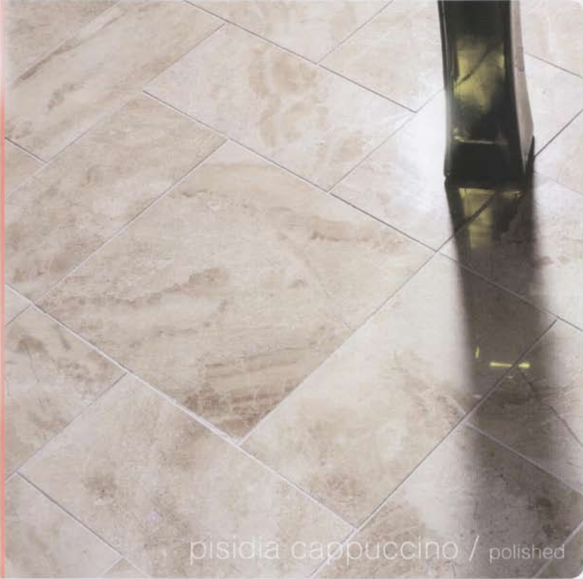
pisida cappuccino / polished