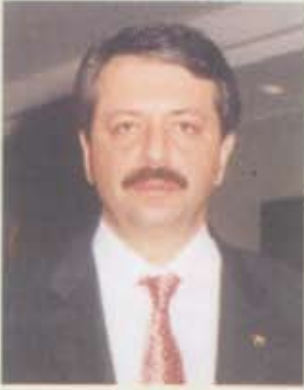
M. Rifat HİSARCIKLIÖĞLU TOBB Yön. Kur. Bşk.