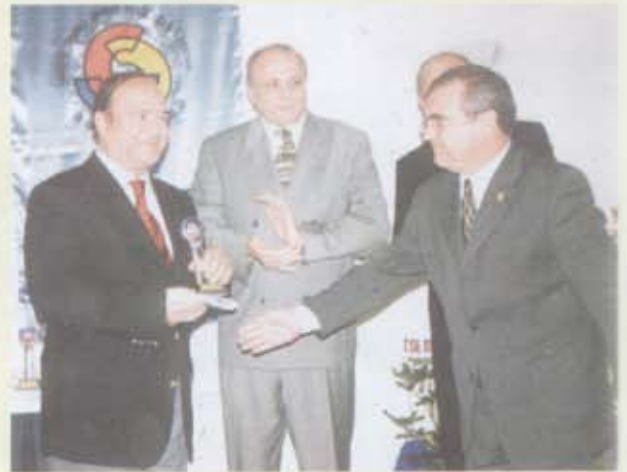
4- Şifa Tabii Soda Tic.Ltd.Şti.