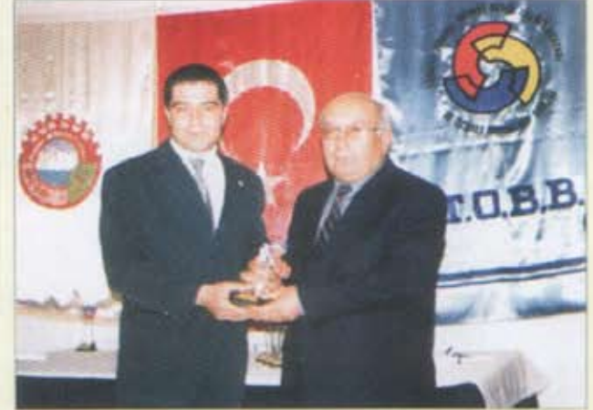
8- Özsoy Nak. Pet. Tur. Tic.Ltd.Şti.