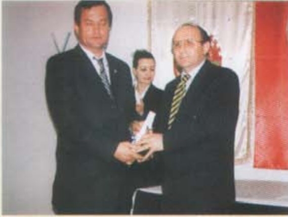
Ekinciler Mermer İşlt. Nak. San. ve Tic. A.Ş.