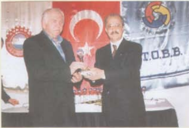
1- Burdur Mensucat San.ve Tic.A.Ş.