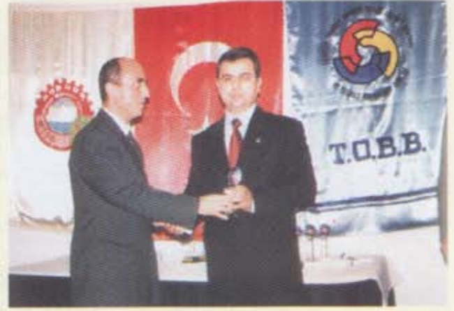
6- Yıldız Silah Sanayi ve Tic.Ltd.Şti.