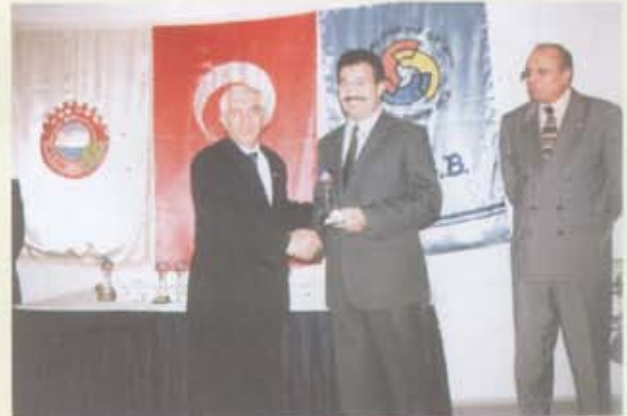
2- Yeşilova Halı Yün İpliği San.ve Tic.A.Ş.