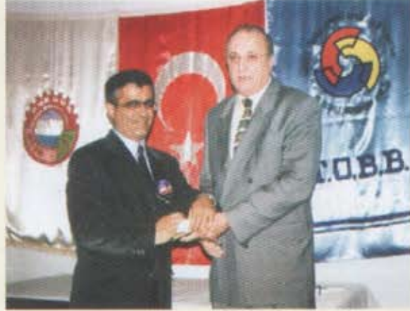
Binaylar Akaryakıt LPG Oto. San. ve Tic. A.Ş.