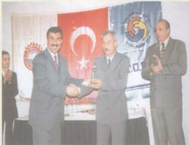
3- Babacanlar İnşaat Mermer Tic. A.Ş.