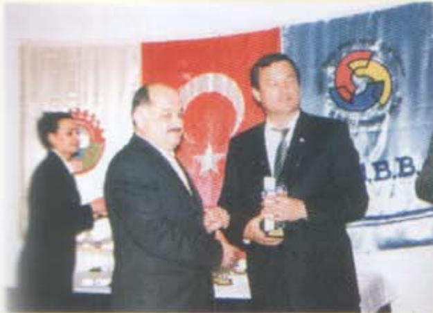
9- Çavuşoğulları Süt Gıda San.ve Tic. A.Ş.