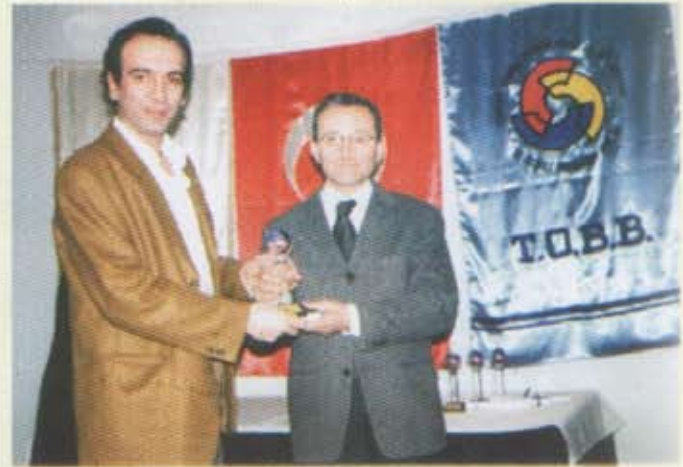
10- Küçükaya Kapl. İth. İhr. Tic.Ltd.Şti.