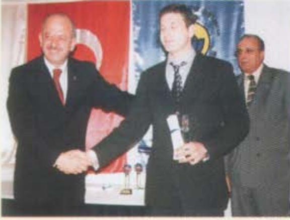
Junior Jeans Wear Dış Tic. Ltd. Şti.