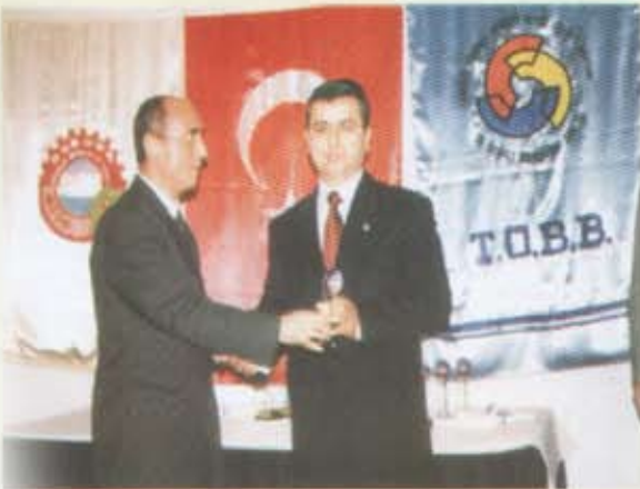
Yıldız Silah Sanayi ve Tic. Ltd. Şti.