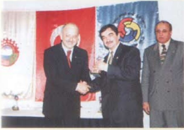
5- Berberoğlu Gıda Sanayi ve Tic.A.Ş.