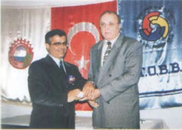
7- Binay Akaryakıt LPG San.ve Tic.A.Ş.