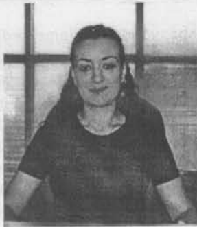
Hesnâ KÇP BTSO Ticaret Sicili Memuru