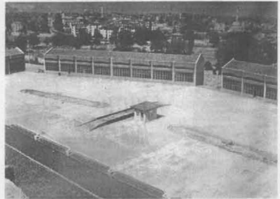
Ticaret Borsası Sitesi'nden görüntüler