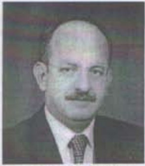
Saifü DANCER BTSO Meclis Başkanı