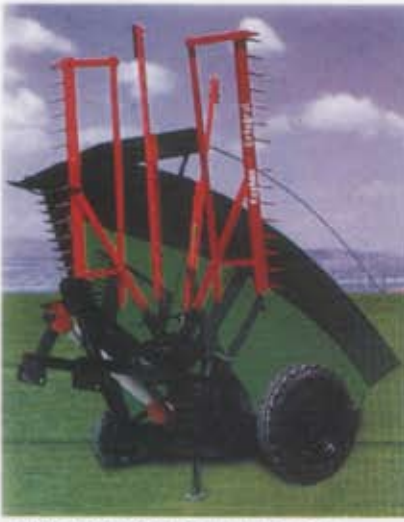
Ekin Biçme Makinası (Hidrolik Tip) Mower With Rakes (Hydraulic Type)