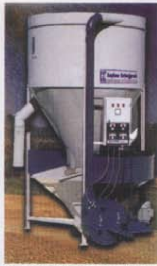
Yem Kırma ve Karma Makinası Grinding and Mixing Machine