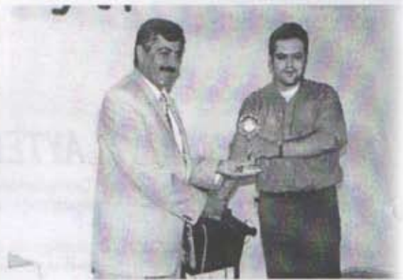
Şerife DURMAZER adına Özgür ÖZTAŞ