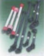
Yeni Makinaları ve Benzeri Yeni / P.T.O. Shaft