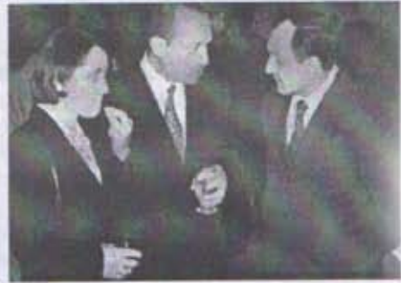
29 Ekim Töreninden Görüntüler