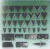
Farklı ve Zorlu İşler İçin Sheaf Knives