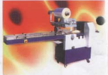
Ekmek Paketleme Makinası Bread Packaging Machine