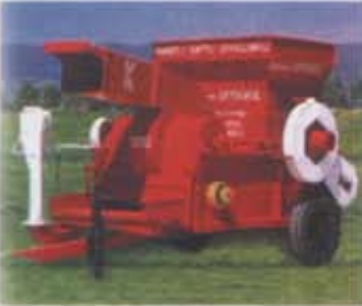
K.E. 120 Tam Teşkilatlı Harman Makinası Thresher With Loading System