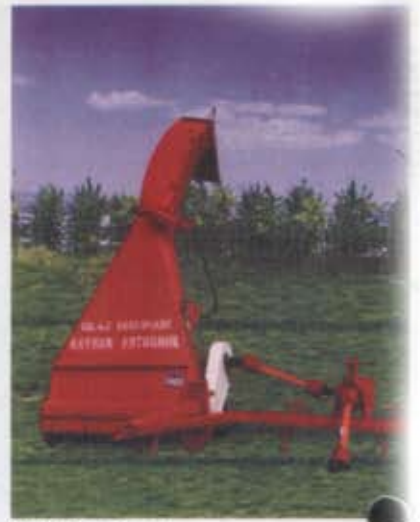
Ot Silaj Makinası Silage Machine For Grass