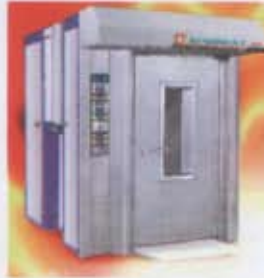
Döner Arabalı-Arabalı Matador Fırınlar / Rotary Bread Oven