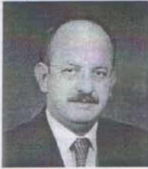
Safii DANCER BTSSO Meclis Başkanı