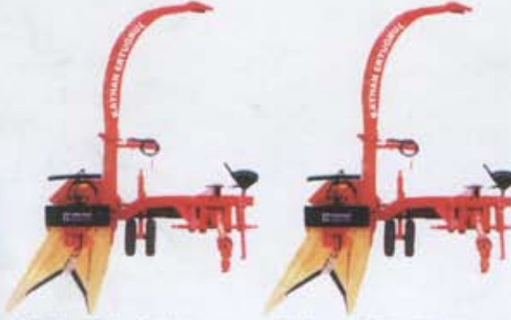
"Yeni" Kayış Tipi Mısır Silaj Makinası "New" Belt style type corn silage machine