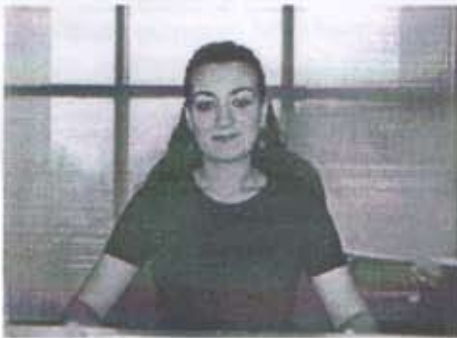
Hesna Kip Ticaret Sicil Memuru