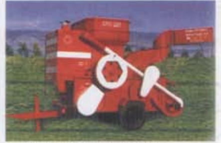
Depolu Harman Mak. (sağlı gezer tip) Thresher With Loading System and P.T.O. Shaft