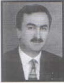
Reşat PETEK E. Cumhuriyet Başsavcısı

Burdur Bucak ilçesi Ürkütlü Kasabası'ndan 1955 doğumlu. Ankara Hukuk Fakültesi mezunu. Ülkemizin değişik bölgelerinde Cumhuriyet Savcısı olarak görev yaptı. Son görevi Yozgat Cumhuriyet Başsavcılığı olup şimdi Fazilet Partisi 1. sıra milletvekili adayı.