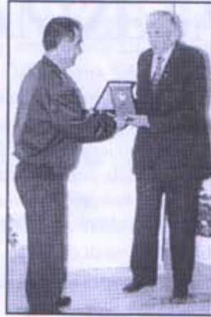
Kızılay Derneği Başkanı Memduh BOYACIOĞLU