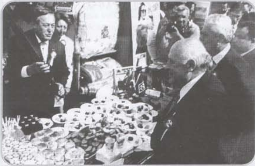
Cumhurbaşkanımız Süleyman Demirel ve Millî Savunma Bakanımız İsmet Sezgin Burdur standını gezerken görülüyor.

Sergi ile ilgili olarak bilgi veren Burdur Valisi Dr.Süleyman Oğuz "Serginin amacı Cumhuriyetle birlikte İllerdeki ekonomik,sosyal ve kültürel gelişmeyi görsel olarak kamuoyuna sunmaktır.Valiliğimizce de bu sergiye katılarak yöremizin kültür varlıkları sergiledik ve en fazla ilgi gören standlardan birisi de Burdur İlinin tanıtıldığı sergiydi." diyerek bu sergiye katkıda bulunan sanayici ve esnafra teşekkür etti.